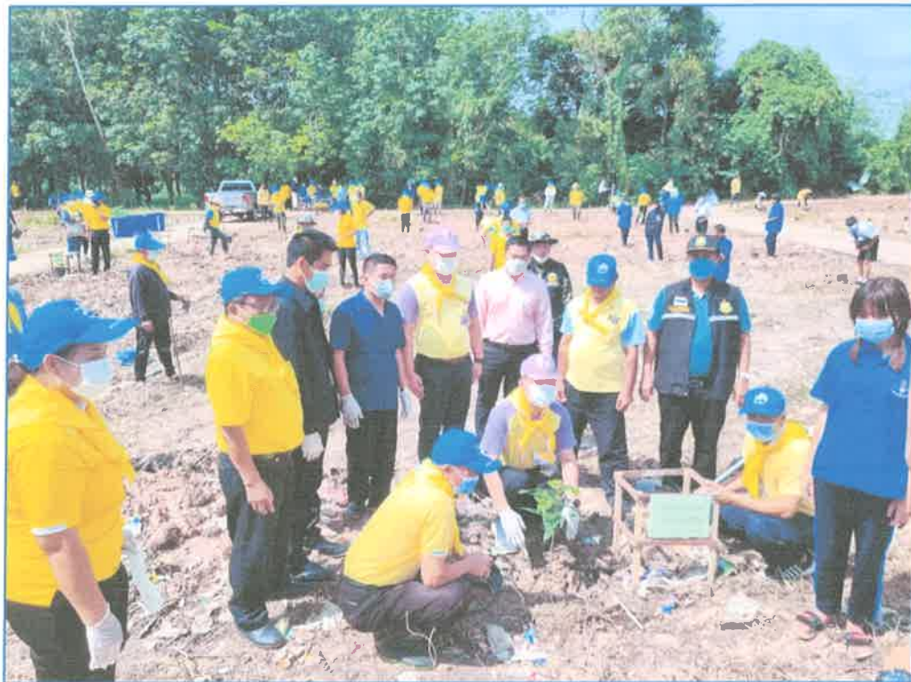
กิจกรรมปลูกต้นไม้และปลูกป่าเฉลิมพระเกียรติ เนื่องในโอกาสมหามงคลพระราชพิธีบรมราชาภิเษก ภายใต้ชื่อ “รวมใจไทยปลูกต้นไม้เพื่อแผ่นดิน” สืบสานสู่ 100 ล้านต้น