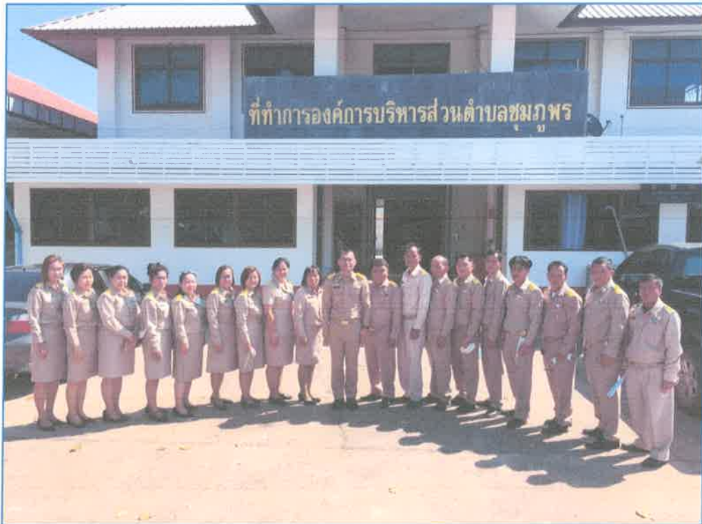
ประชุมสภาครั้งแรก องค์การบริหารส่วนตำบลชุมภูพร(7 กุมภาพันธ์ 2565)