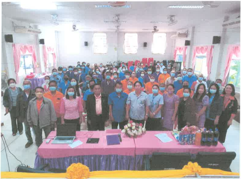
โครงการช่วยเหลือการติตเอดส์ จากแม่สู่ลูกสภากาชาดไทย