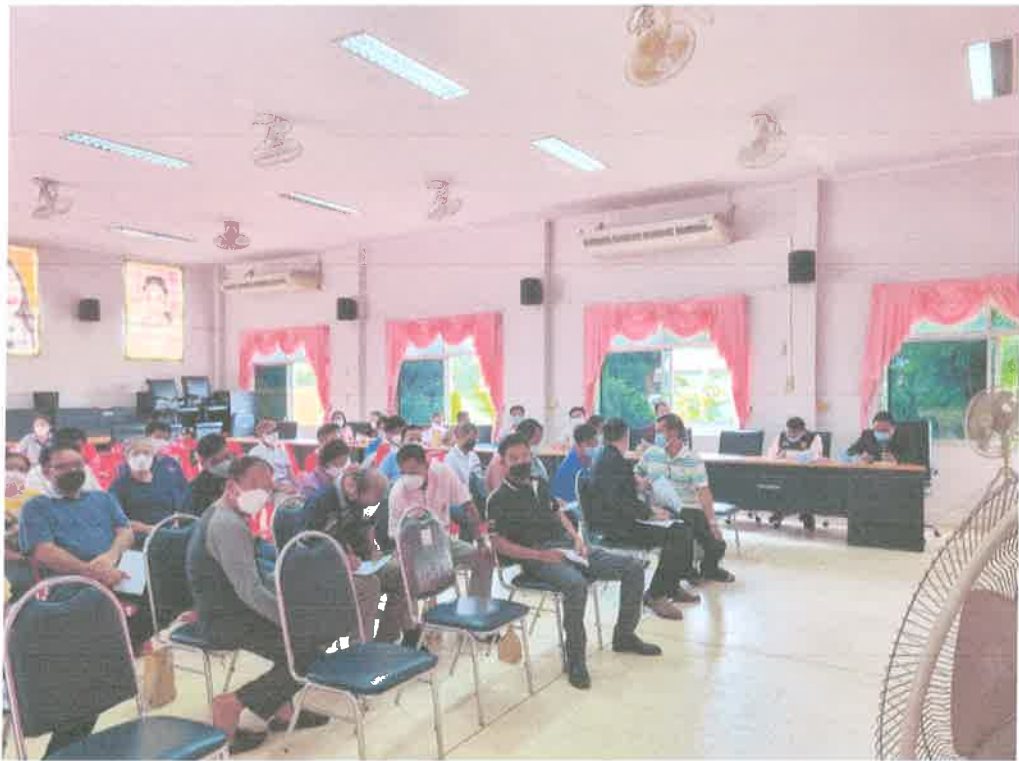
โครงการประชุมประชาคมจัดทำแผนพัฒนาท้องถิ่น พ.ศ.2566-2570 ฉบับเพิ่มเติม/เปลี่ยนแปลงแผน ครั้งที่ 2/2565