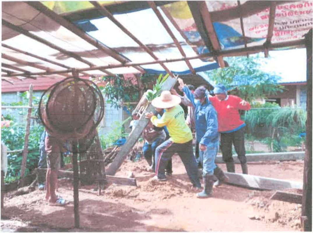
โครงการปรับปรุงที่อยู่อาศัยผู้ด้อยโอกาส