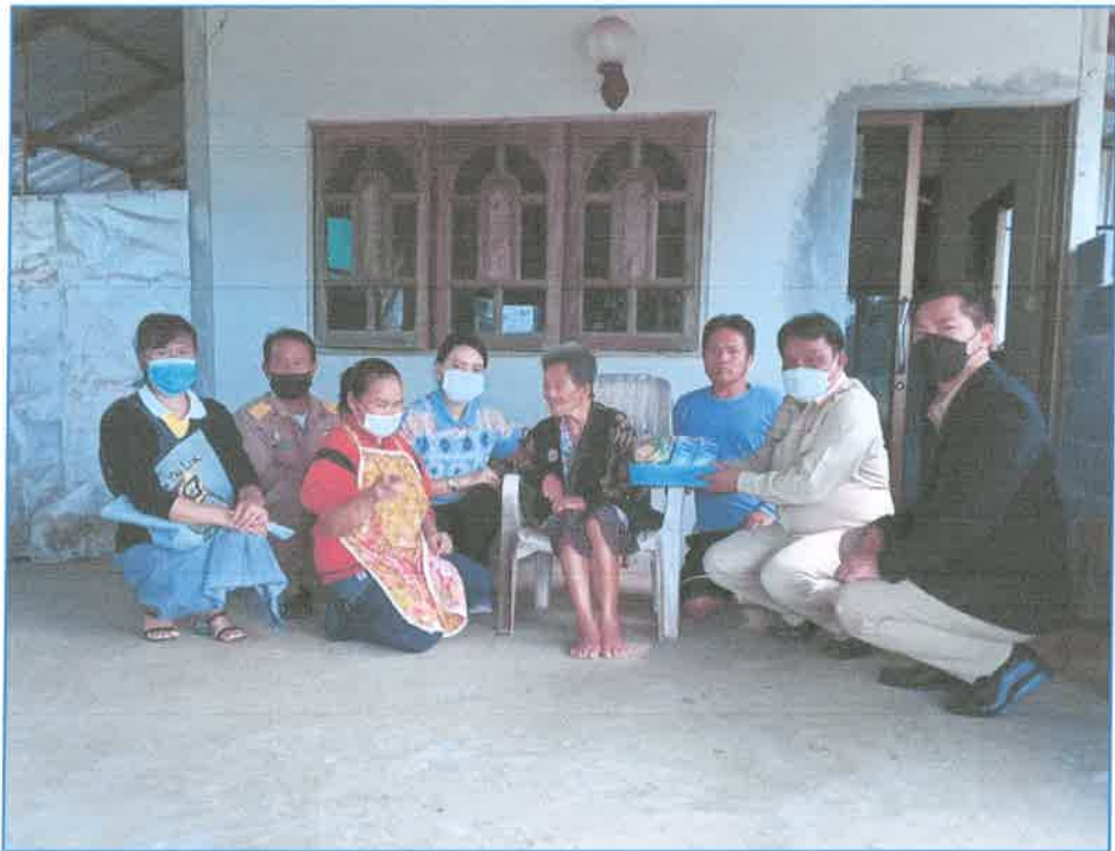
โครงการออกเยี่ยมบ้านผู้พิการและผู้สูงอายุ