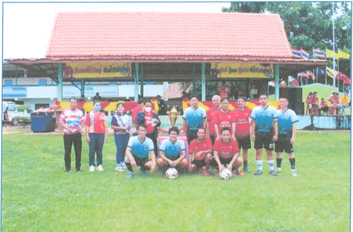
โครงการกีฬา อบต.สัมพันธ์ด้านยาเสพติด ประจำปี 2565