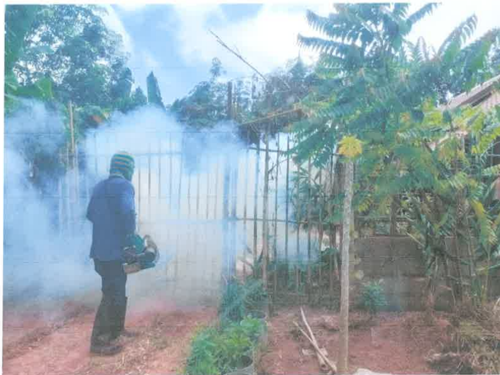
โครงการป้องกันและควบคุมโรคไข้เลือดออก ประจำปีงบประมาณ 2565