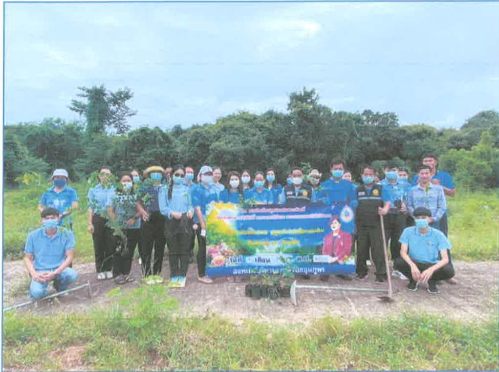
โครงการทอ้งถิ่นปลูกป่าเฉลิมพระเกียรติ สมเด็จพระนางเจ้าสิริกิติ์ พระบรมราชินีนาถ พระบรมราชชนนีพันปีหลวง รวมใจทอ้งถิ่นไทย ปลูกต้นไม้เพื่อแผ่นดิน สืบสานสู่ 90 ล้านต้น