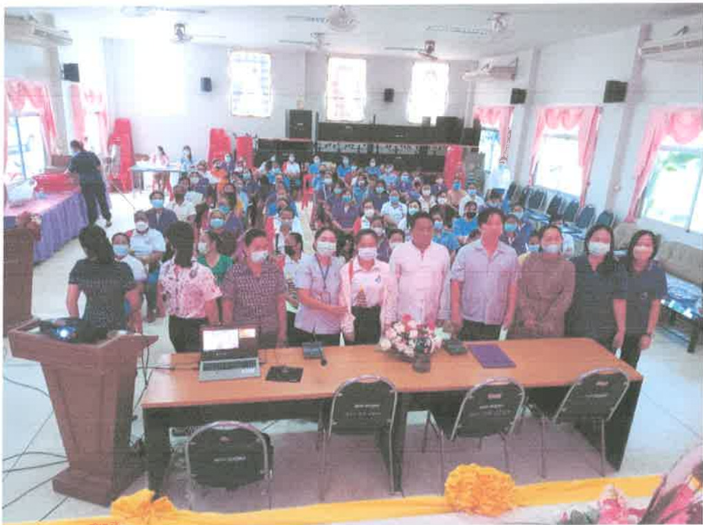
โครงการสืบสานพระราชปณิธานสมเด็จพระเจ้าตากสินมหาราช