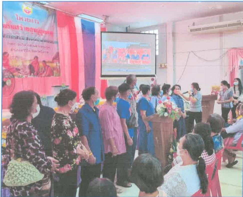
โครงการปณิรมสร้างสุขผู้สูงอายุ