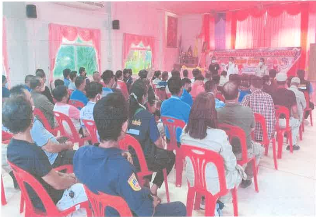
โครงการฝึกอบรมการป้องกันและระงับอัคคีภัย การกู้ชีพกู้ภัยชุมชน