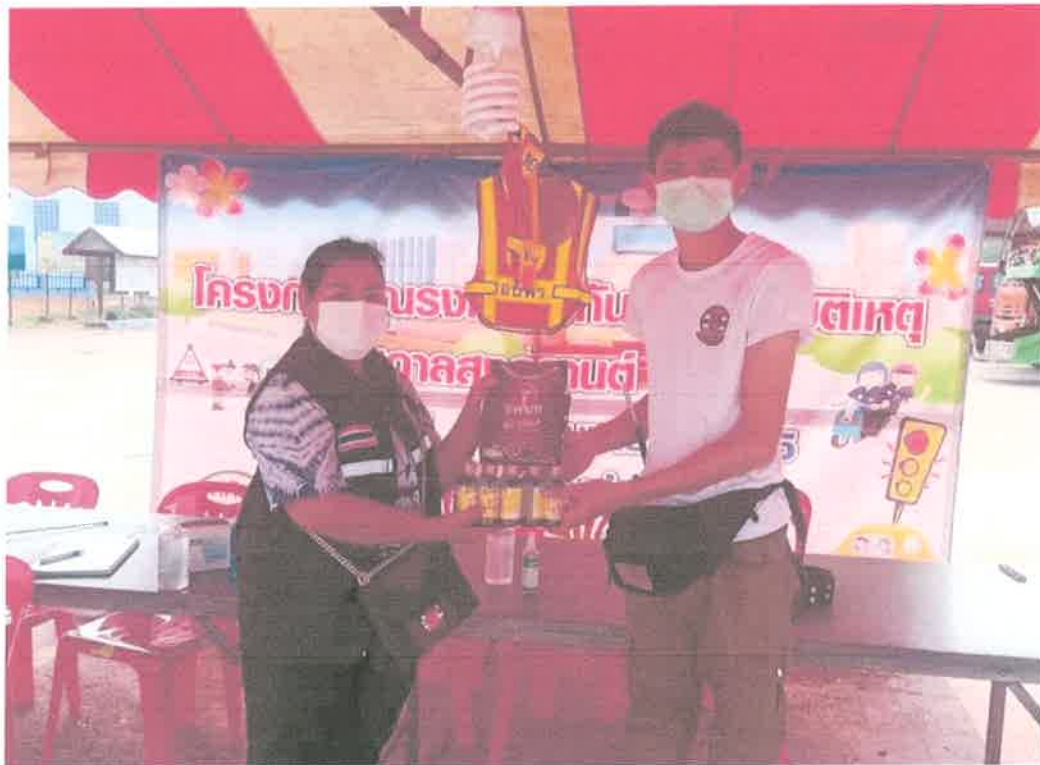
โครงการลดอุบัติเหตุทางถนนเทศกาลสงกรานต์