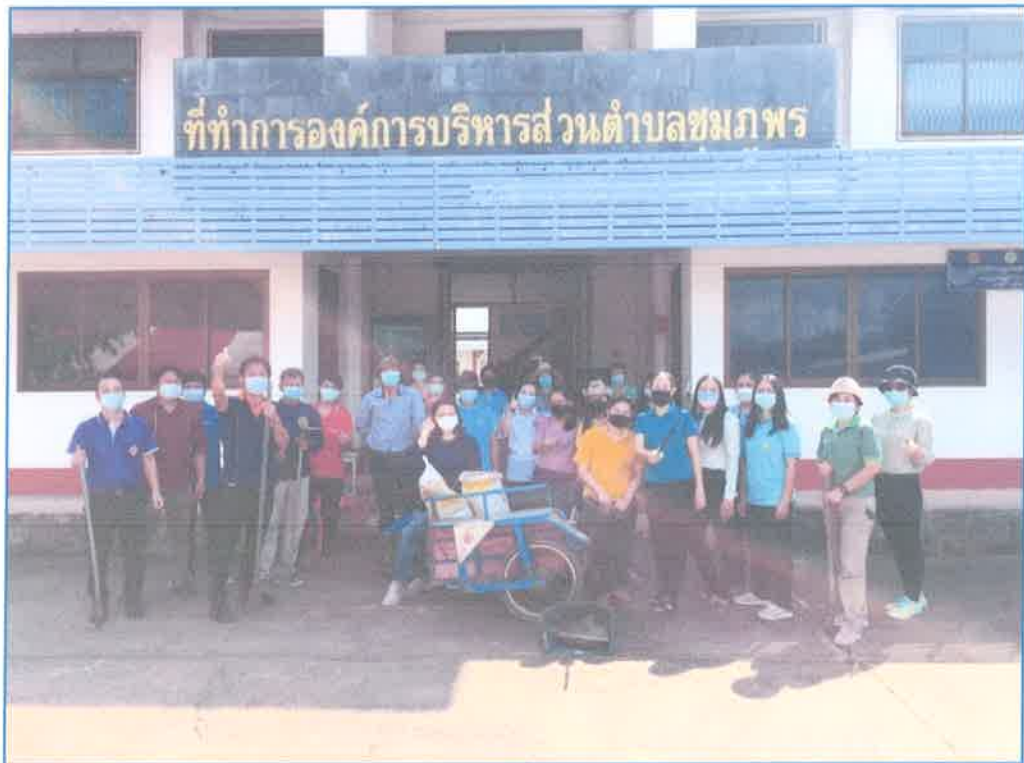
วันรักต้นไม้ ประจำปี 2564 (21 ต.ค. 2564)