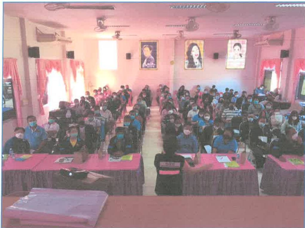
โครงการการเลือกตั้งองค์การบริหารส่วนตำบลชุมภูพร