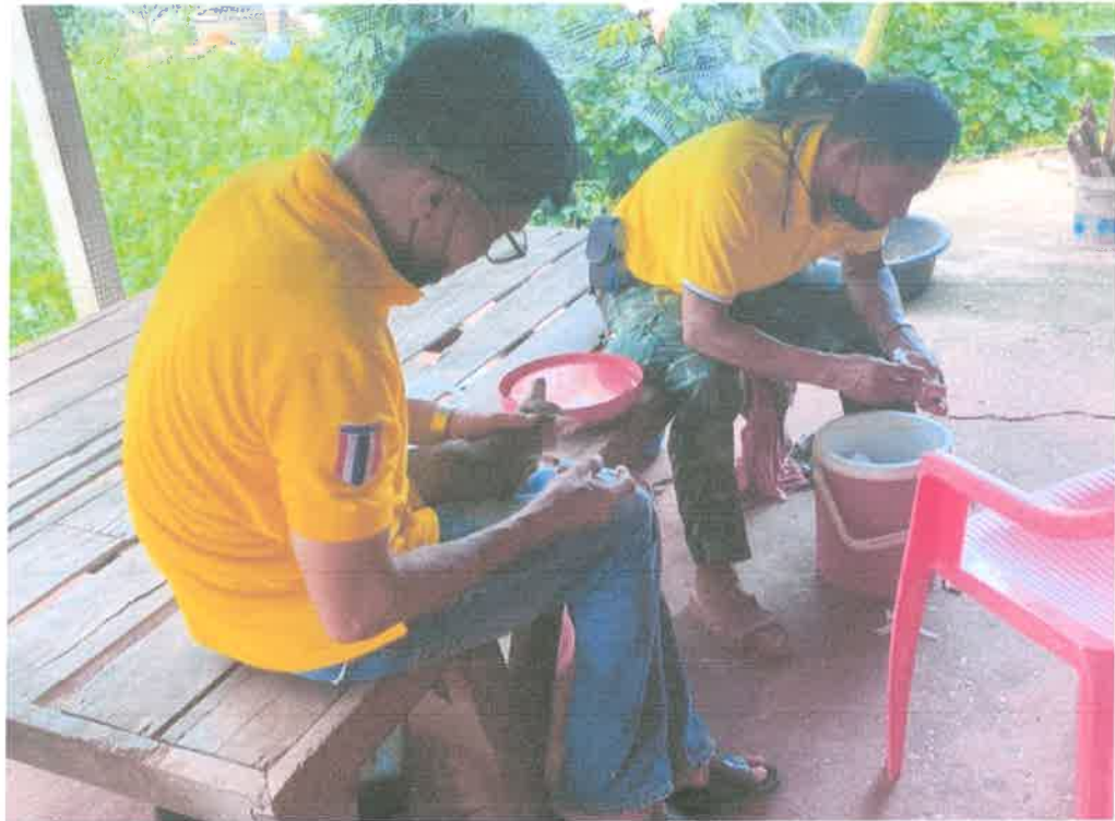
โครงการสัตว์ปลอดโรค คนปลอดภัย จากโรคพิษสุนัขบ้า