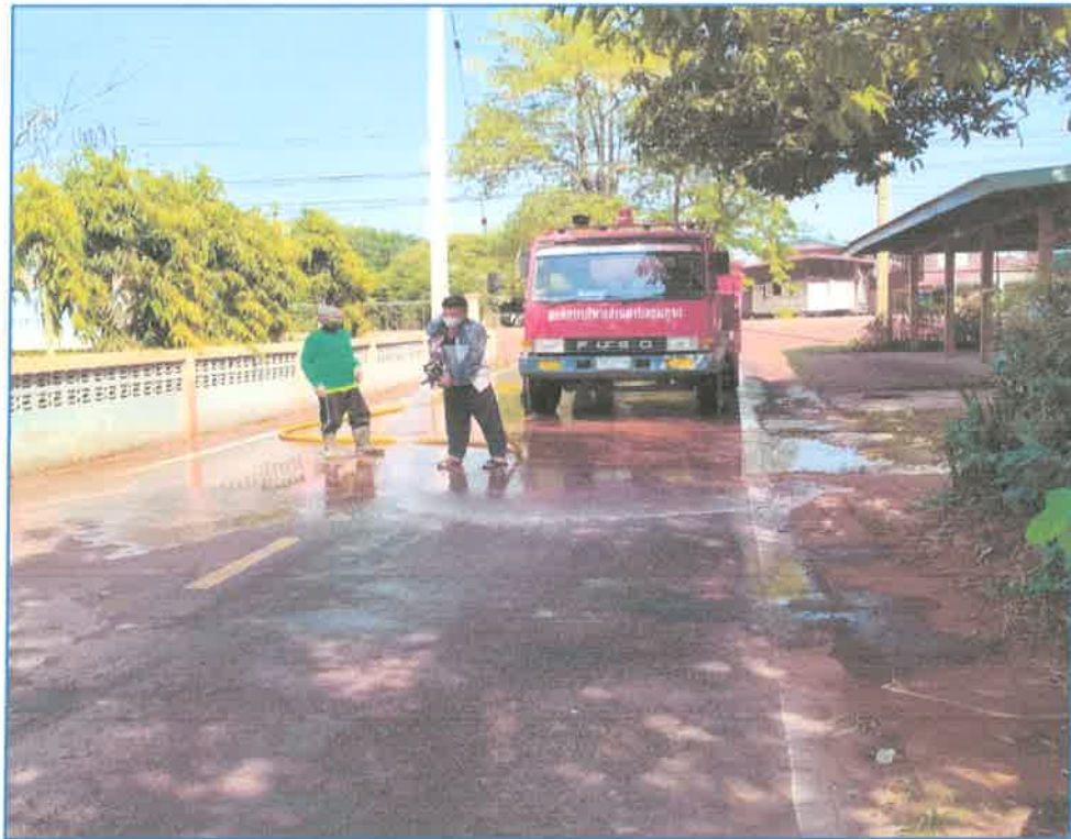
ทำความสะอาด ล้างถนนสาธารณะ