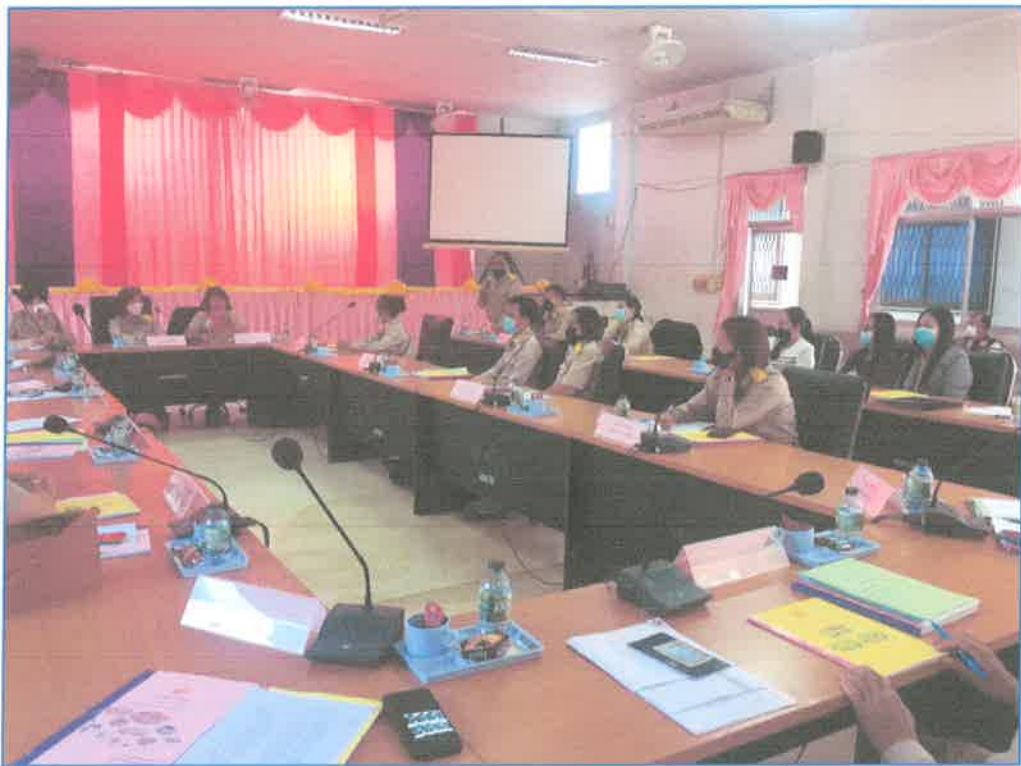
นายกองค์การบริหารส่วนตำบลชุมภูพรแถลงนโยบายต่อสภาฯ (11 กุมภาพันธ์ 2565)