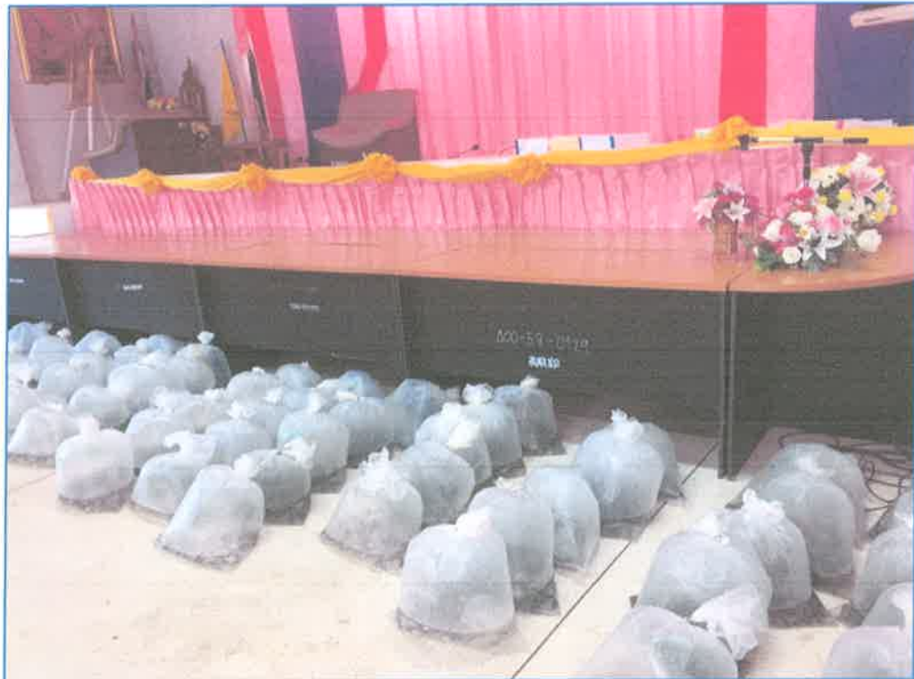
โครงการปล่อยพันธ์สัตว์น้ำ ประจำปี 2565