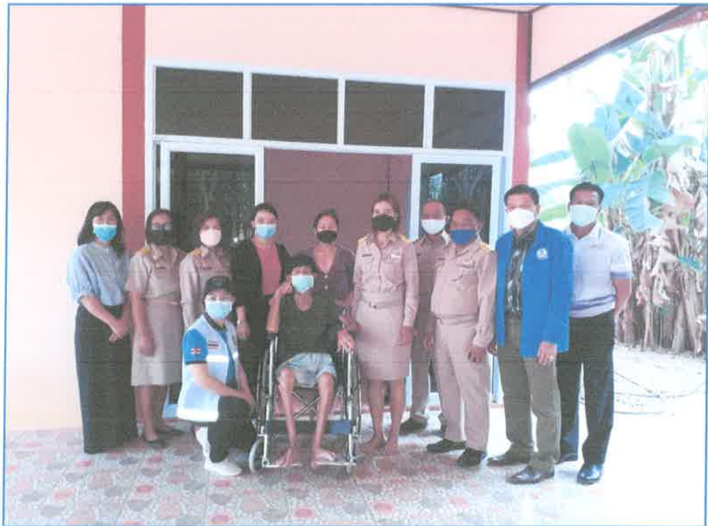
โครงการมอบรถเข็นให้กับผู้พิการ