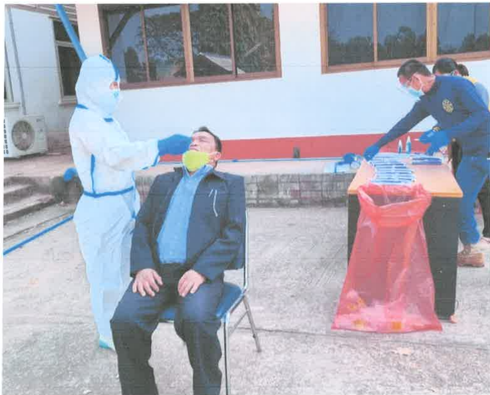
โครงการป้องกันและควบคุมโรคติดต่อ